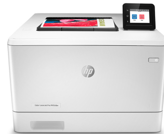
HP Color LaserJet Pro M454dw

Принтер с поддержкой динамической безопасности. Предназначен для использования только с картриджами, оснащенными оригинальной микросхемой HP. Картриджи с микросхемами других производителей могут не работать, а работающие в настоящее время могут не работать в будущем. Подробнее см. на веб-сайте по адресу: