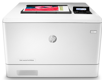
HP Color LaserJet Pro M454dn

Для успеха в бизнесе необходимо работать умнее. Принтер HP Color LaserJet Pro M454 разработан, чтобы позволить вам сосредоточиться на важнейших задачах — развитии бизнеса и опережении конкурентов.